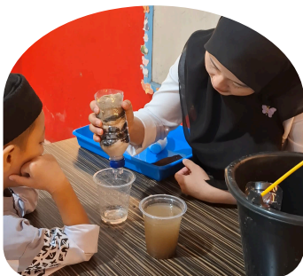
Sains & Penemuan Sederhana