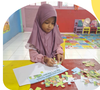
Matematika Awal & Pemecahan Masalah