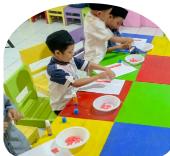
Keterampilan Motorik Halus dan Kasar