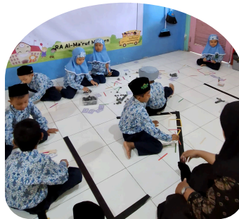
Bahasa & Literasi