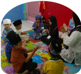
Perkembangan Sosial & Emosional

Kurikulum kami berfokus pada bidang pengembangan utama sebagai berikut: