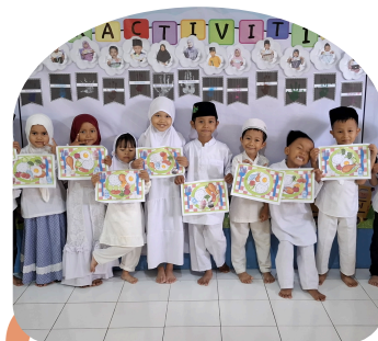
Kreativitas & Imajinasi