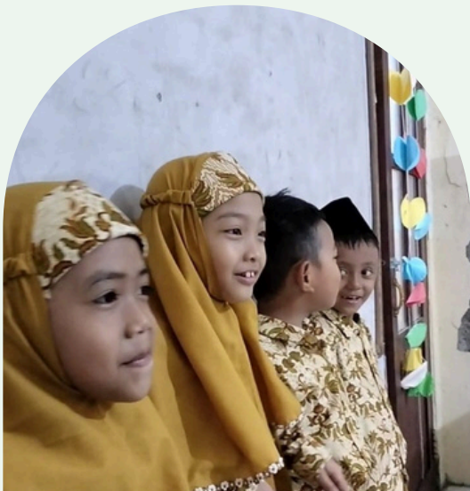
Komunikator yang percaya diri