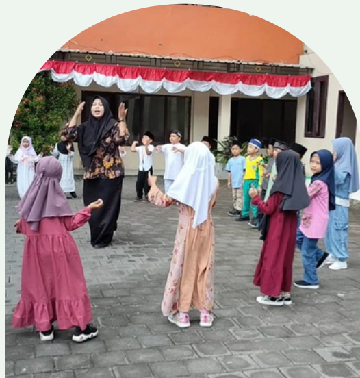
Pembelajar yang Gembira