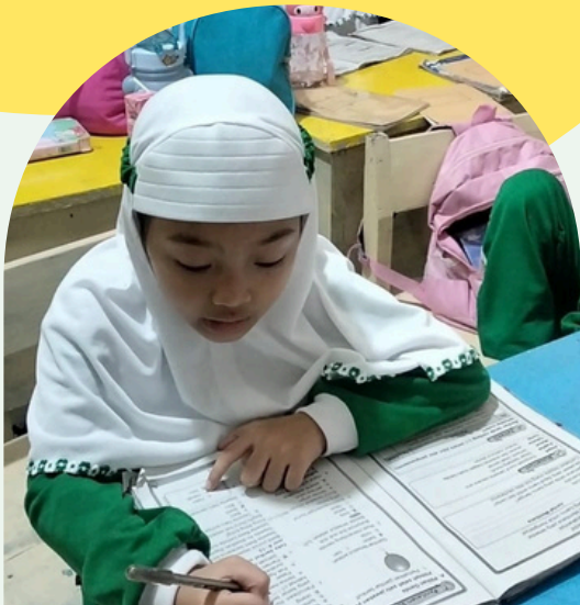
Pembelajar yang ingin tahu